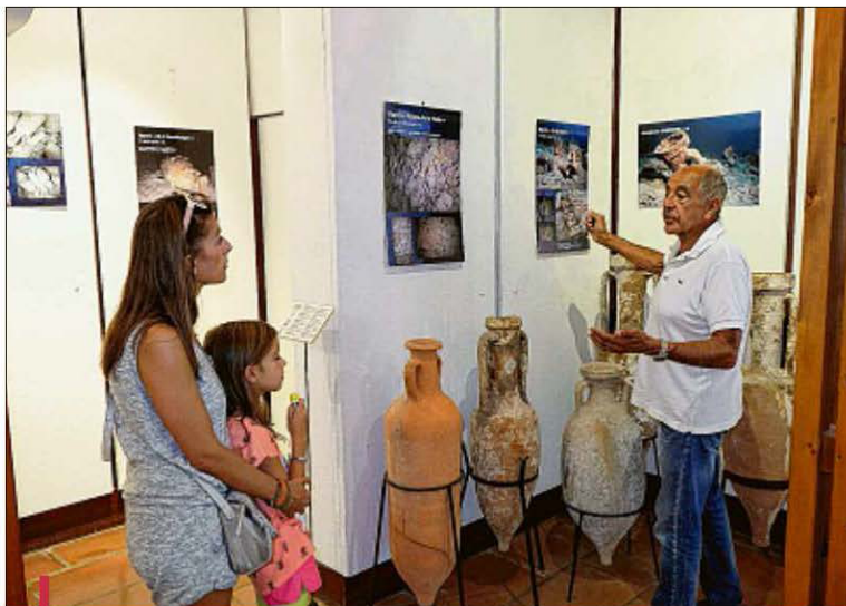
Les visiteurs du musée découvriront la richesse archéologique du Cassis antique, sur terre et sous la mer.